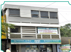
शाखा - गडहिंग्लज