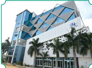
बुलडाणा अर्बन रेसीडेन्सी क्लब