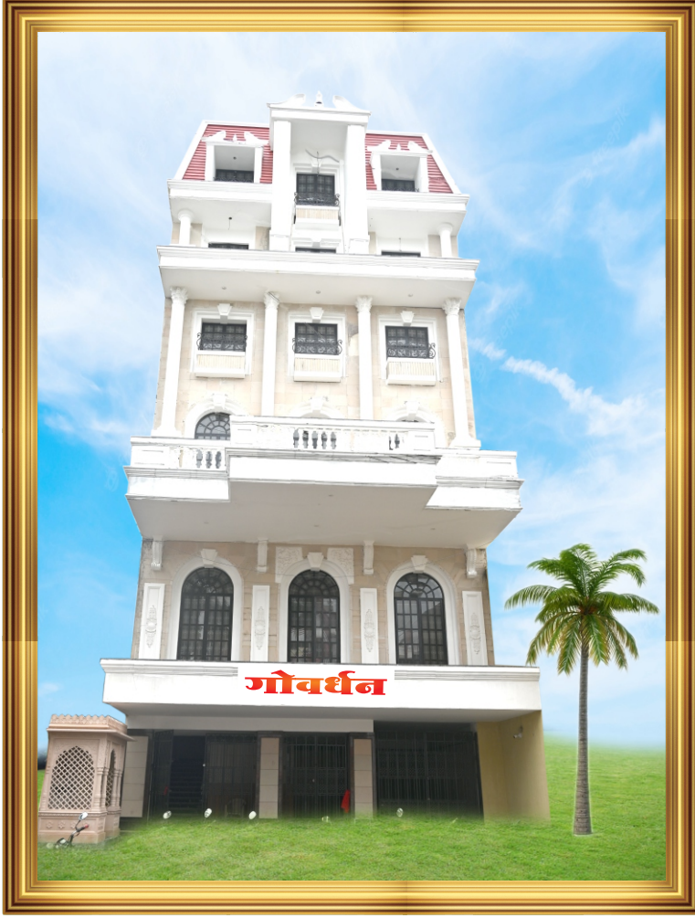
‘गोवर्धन’ बुलडाणा अर्बन प्रशासकीय इमारत