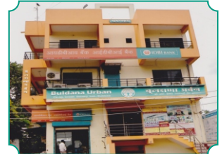
शाखा - चोपडा