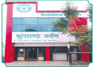
शाखा - औसा