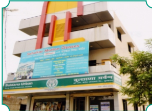
शाखा - महिला मलकापूर