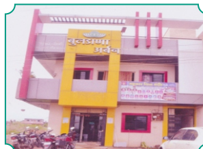
शाखा - बिबी