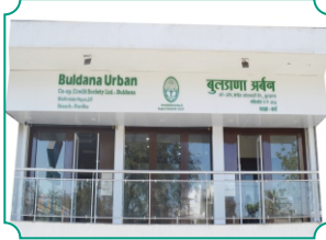
विभागीय कार्यालय, वर्धा