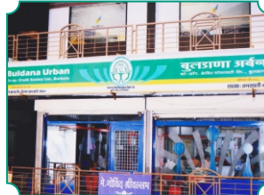
शाखा - अमरावती