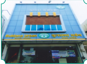
विभागीय कार्यालय, वाशिम