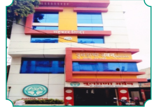
विभागीय कार्यालय, परभणी