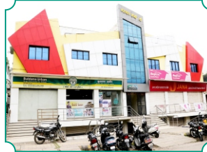
विभागीय कार्यालय, नांदेड