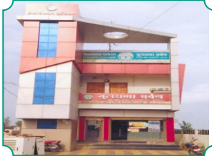
शाखा - उंद्री