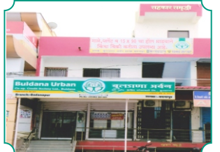
शाखा - बदनापूर