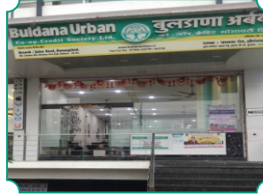
विभागीय कार्यालय, औरंगाबाद