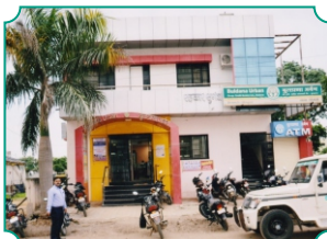
विभागीय कार्यालय, हिंगोली