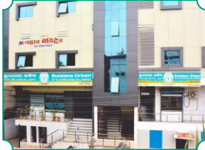
विभागीय कार्यालय, खामगांव