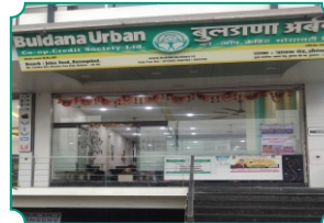
विभागीय कार्यालय, औरंगाबाद