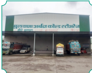
मलकापूर कोल्ड स्टोअरेज