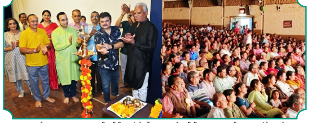
बुलडाणा अर्बनच्या ३९ व्या स्थापना दिनानिमित्त संस्थेतर्फे महाराष्ट्रातील विविध भागात सुप्रसिद्ध नाटकांचे आयोजन करण्यात आले या नाट्यप्रदर्शनाचा बुलडाणा अर्बनच्या सर्व ग्राहक सभासदांना मोफत लाभ घेतला. या नाट्यप्रदर्शनासाठी बुलडाणा अर्बनतर्फे सर्व ग्राहक, सभासद सर्वांनी भरभरून प्रतिसाद दिला.