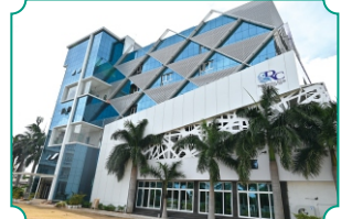
बुलडाणा अर्बन रेसीडेन्सी क्लब