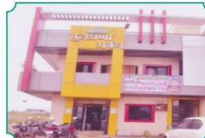
शाखा - बिबी