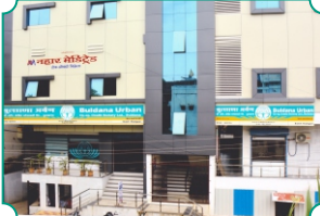
विभागीय कार्यालय, खामबां