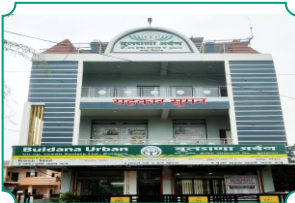
विभागीय कार्यालय, सिल्लोड