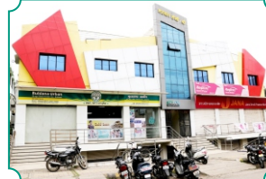
विभागीय कार्यालय, नांदेड