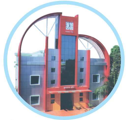
‘सहकार सेतू’ मुख्य कार्यालय