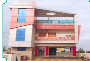
शाखा - उंद्री