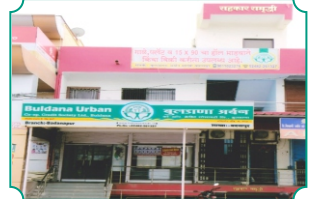
शाखा - बदनापूर