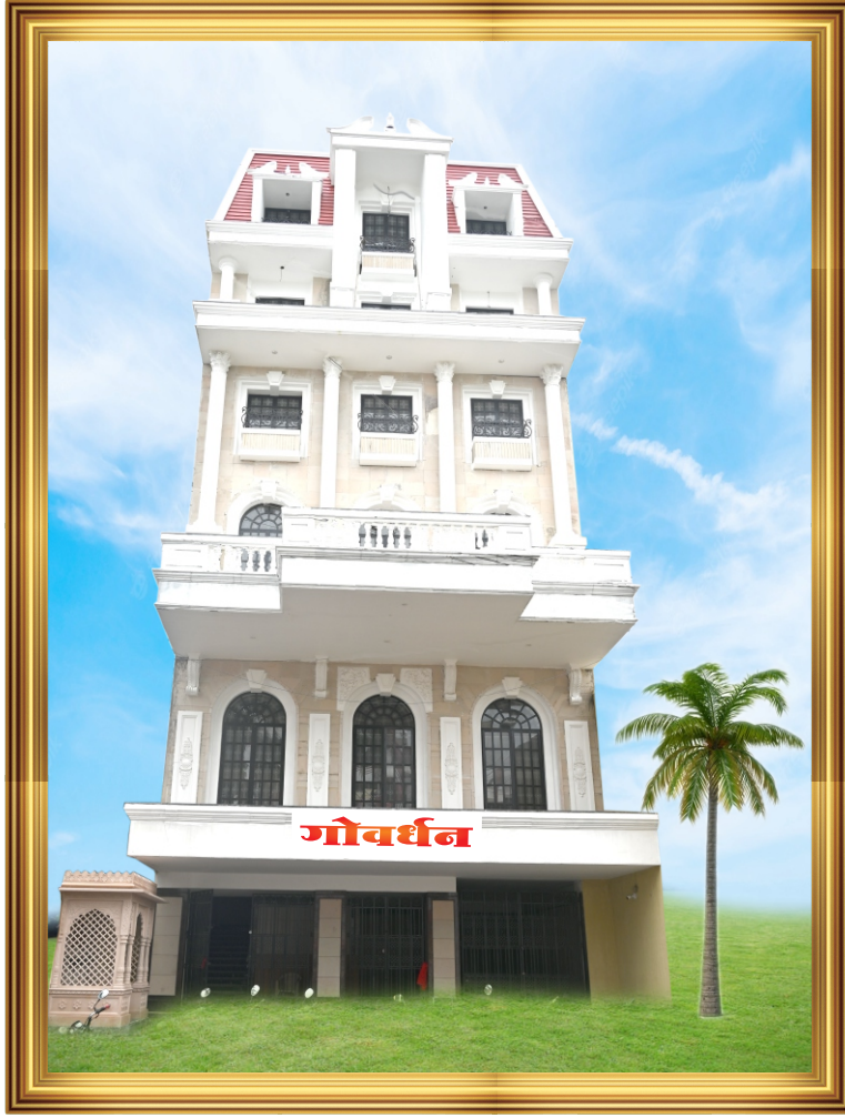
‘गोवर्धन’ बुलडाणा अर्बन प्रशासकीय इमारत