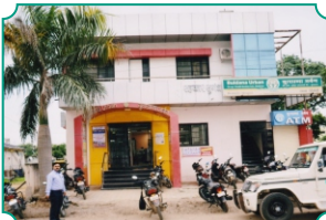
विभागीय कार्यालय, हिंगोली