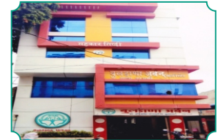
विभागीय कार्यालय, परभणी