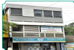
शाखा - गडहिलज