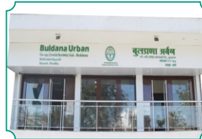
विभागीय कार्यालय, वर्धा